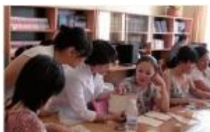
国际图联保存保护核心项目韩国中心在蒙古国家图书馆举办的文献保存研讨会

2010年，通用机读目录格式常设委员会（PUC）开展了一项修订工作，集中精力为ISBD文献著录第0项的完成和运用书目记录的功能需求（FRBR）的概念和术语在未来实现格式的统一等升级工作提供准备。UNIMARC资源描述与检索（RDA）的含义和UNIMARC准则手稿的筹备工作均是当前的热点议题。UNIMARC/馆藏格式并无任何改变。UNIMARC/分类格式正在发展中。未来的工作中将考虑UNIMARC与RDA和ISBD命名空间的映射，这也将反过来影响万维网联盟（W3C）图书馆关联数据孵化小组的工作。