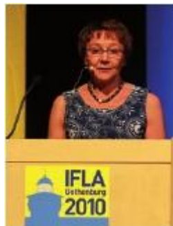
阿格妮塔·奥尔森 (Agneta Olsson) 国家委员会主席