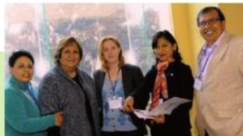
秘鲁项目成员六月会面