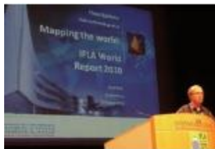
2010年国际图联世界报告发布现场。该报告由信息自由获取与言论自由委员会和南非比勒陀利亚大学联合推出，由瑞典国际发展合作署（Sida）资助。